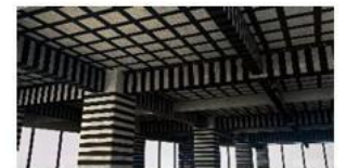
Revestimiento y protección