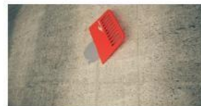
Regularización (si fuese necesaria)