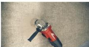
Preparación del soporte

Verificación del refuerzo: Una vez que el adhesivo se haya secado por completo, se debe comprobar que los tejidos no presenten puntos huecos, golpeándolos manualmente.