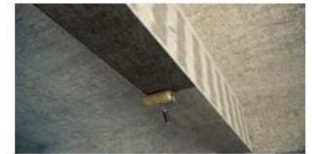
Capa adhesivo de laminación Qi-Tech Resin 31-S