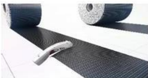
Corte y preparación del tejido Qi-Tech Sheet