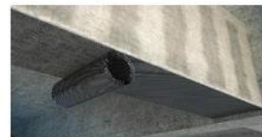
Aplicación del tejido presionando en dirección de las fibras sobre la resina