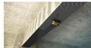
Acabado con rodillo o espátula. Capa de sellado en tejidos de 600 gr/m 2