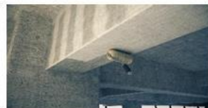
Imprimación (si fuese necesaria)